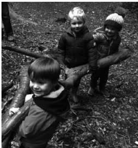
Cic Bang Felin yn cael hwyl yng Nghoedwig Penrhyn

YMESTYN ALLAN – Rwyf yn parhau i ymweld ag ysgolion lleol, ac yn ychwanegol i'r ymweliadau arferol rwyf wedi cael y cyfle i fynd i Ysgol Hirael ac i Gylch Meithrin y Garnedd i rannu negeseuon Diolchgarwch. Hefyd mynychais weithgaredd Pnawn Hwyl Menter Iaith Bangor yn Popdy i rannu gwybodaeth ynglŷn a gweithgareddau'r capel.