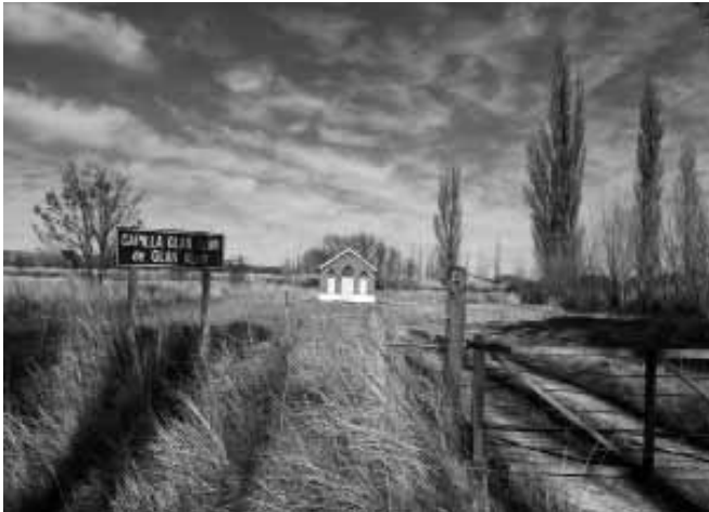
Capel Glan Alaw yn Nyffryn Camwy