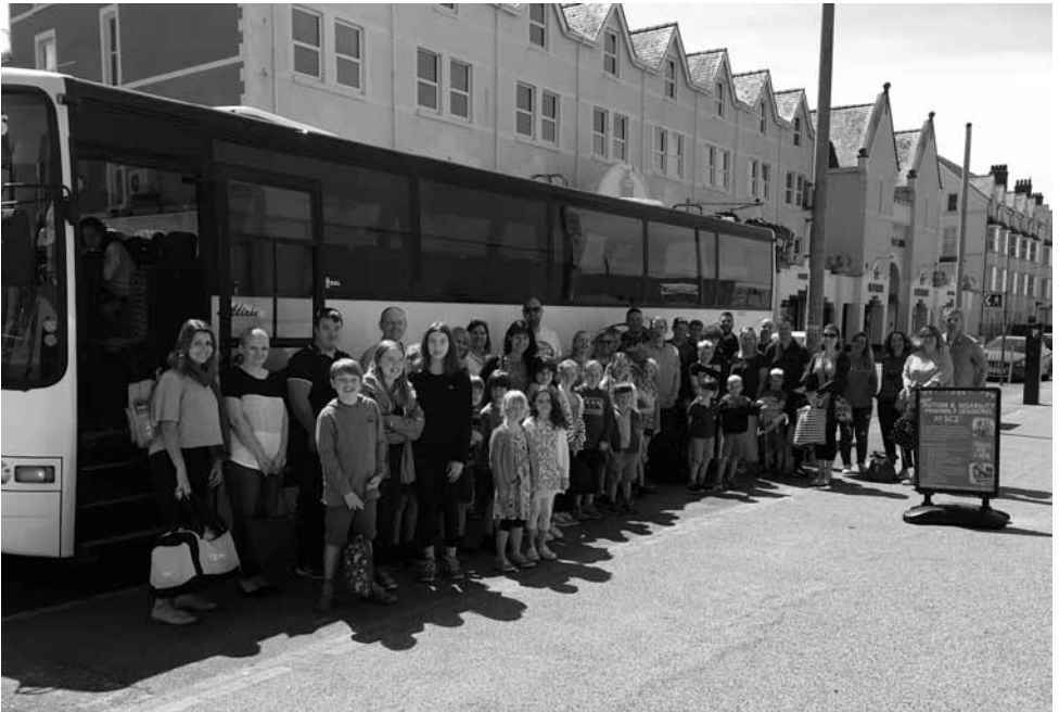
Y trip pen tymor i SC2