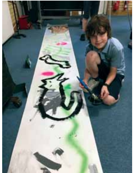
Uchod ac ar y dde: sesiwn grefftau CIC Bach.