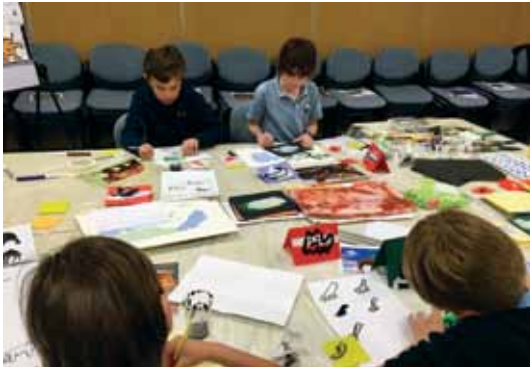
Llun uchaf: aelodau Clwb CIC Felin a'u teuluoedd ar ymweliad â Chanolfan Fulod Eryri, Moelcylci.