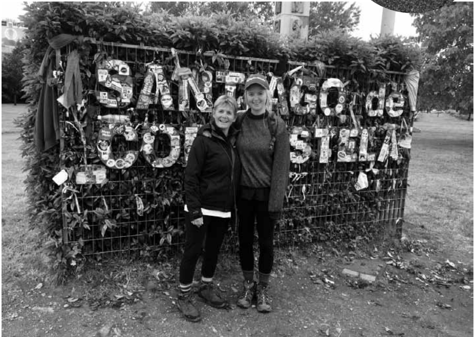
Modlen a Casi wedi cyrraedd pen eu taith