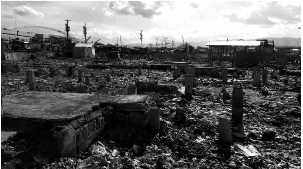
'Ground zero' Mantuyong yn dilyn y tân anferth ym mis Mawrth 2016