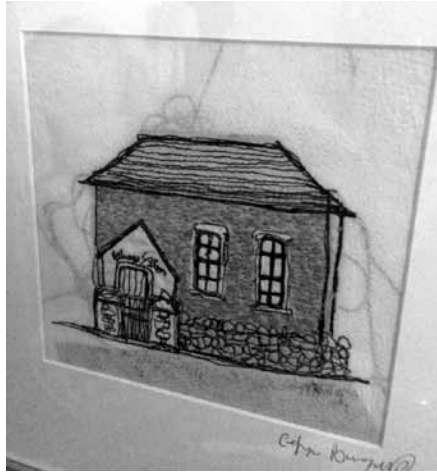
Eglwys y Glyn gan Cefyn Burgess (darlun brodwaith)

Mae'r edafedd yn chwyrlio fel rhubanau a balwnau, ac afiaith ym mhwythi cerrig y wal sy'n gwarchod libart cul y capel. Ymddengys fel petai'r Glyn yn llawenhau, ei fod ar fin ei ddyrchafu i'r entrychion gan ei lynnau o edau, a chan nerth yr hyn a fu: y penlinio yn y sêd fawr a'r gweddiau o'r frest.